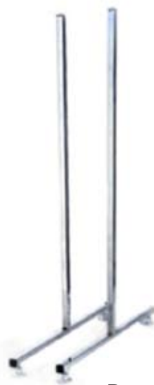
Base para piso